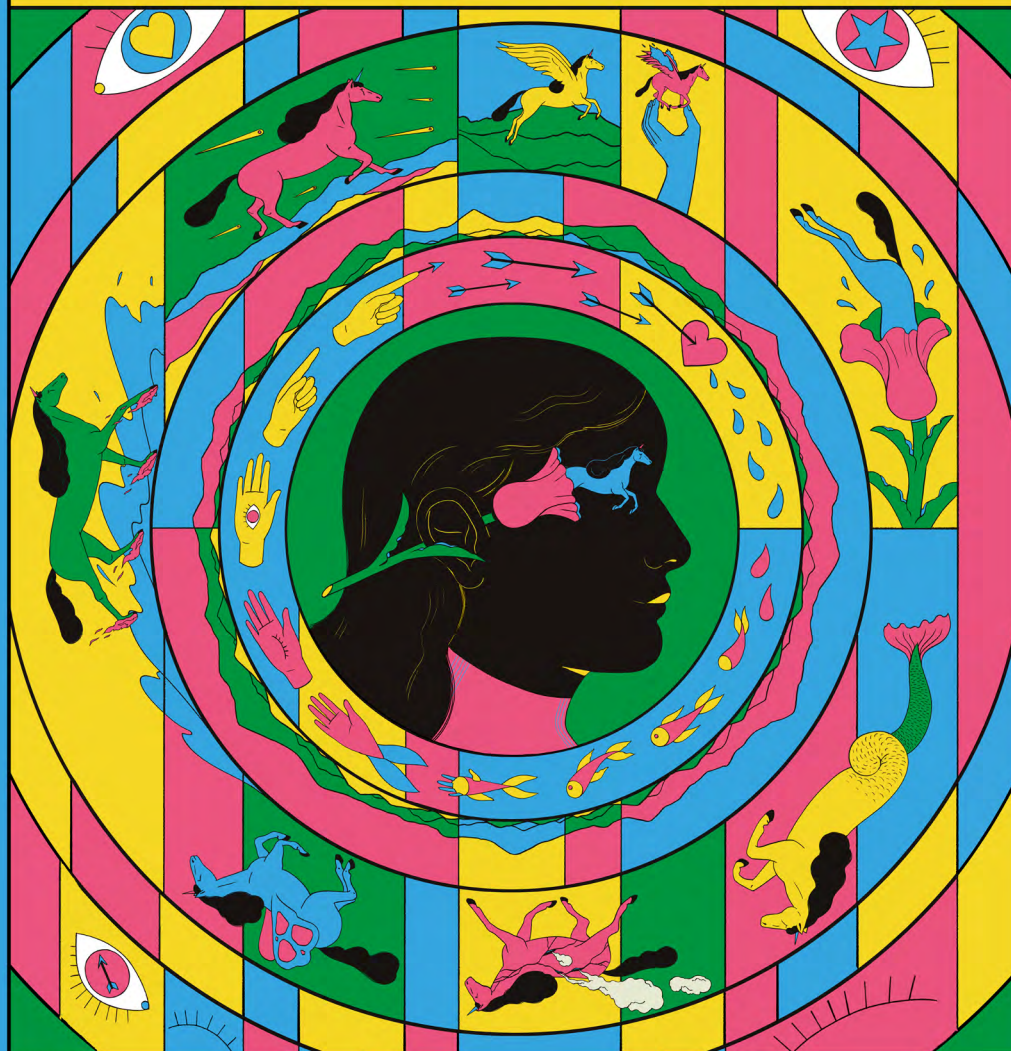
ILUSTRACIÓN: CRISTINA DAURA

II FESTIVAL INTERNACIONAL DE ANIMACIÓN AFUNDACIÓN